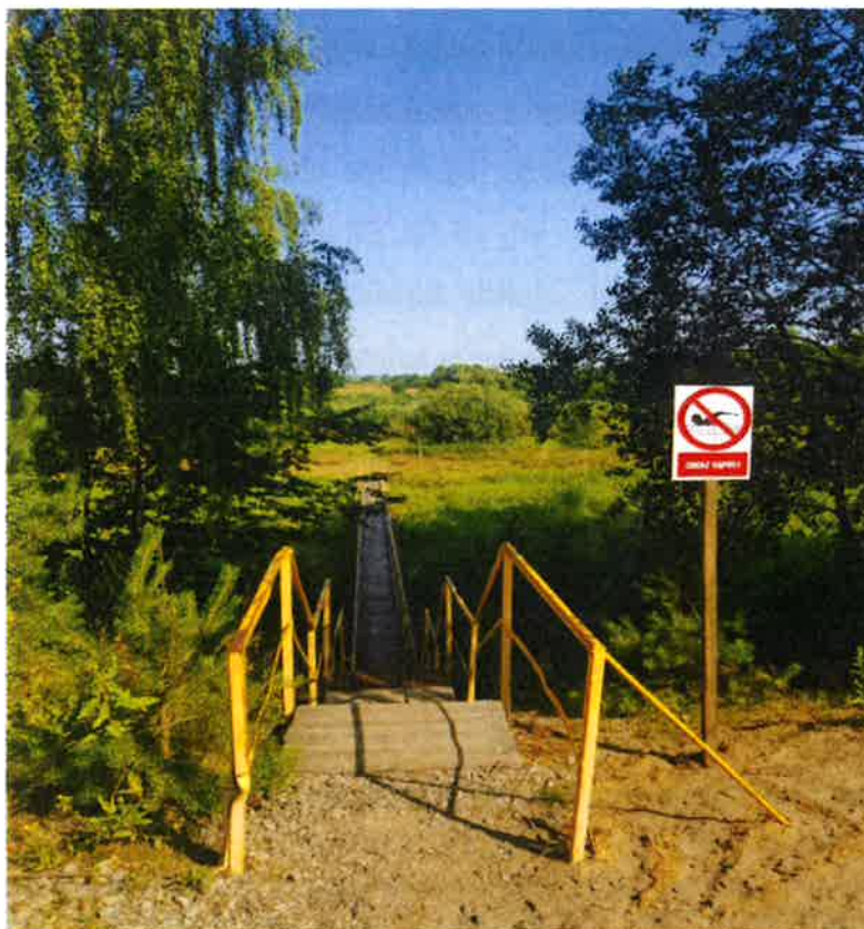
Rzeka Pilica w miejscowości Biała Góra

Biała Góra pełni funkcję miejscowości wczasowej. Jest tu wiele ośrodków i indywidualnych domków wycieczkowych. Odcinek rzeki Pilicy w miejscowości Biała Góra, z uwagi na spadek podłoża wokół brzegu oraz zejście w postaci drewnianego pomostu zachęca mieszkańców i wczasowiczów do kąpieli i skoków. Teren wokół koryta rzeki został oznakowany tablicą „ZAKAZ KĄPIELI”. Miejsce to zostało zakwalifikowane jako „dzikie kąpielisko”. Akwen wodny oznakowany i niestrzeżony.